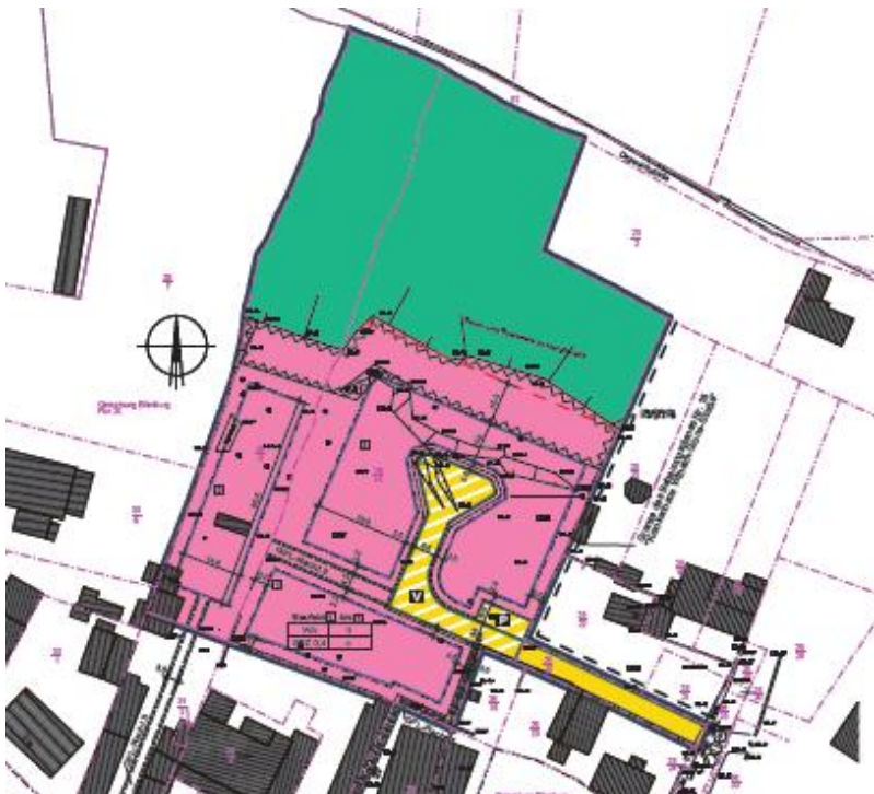
Auszug aus dem Bebauungsplan Nr. 25 „Wohnanlage Auenblick - Wilhelm-Grune-Straße“

Da es sich hierbei um eine Fortführung der bereits vorhandenen Wilhelm-Grune-Straße handelt, soll auch dieser Straßenabschnitt so bezeichnet werden.