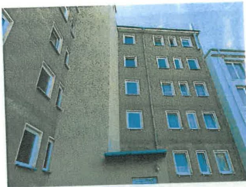
Fassade - Rückseite