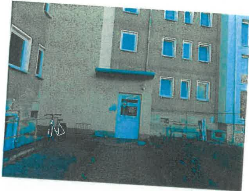
Zugang - Rückseite