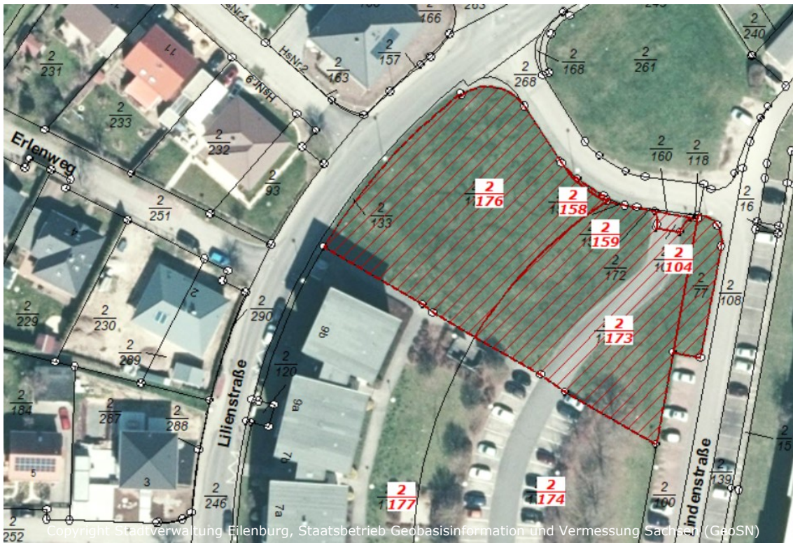
Flurstücke 2/104, 2/158, 2/159, 2/173, 2/176, Flur 33, Gemarkung Eilenburg (rot gekennzeichnet)