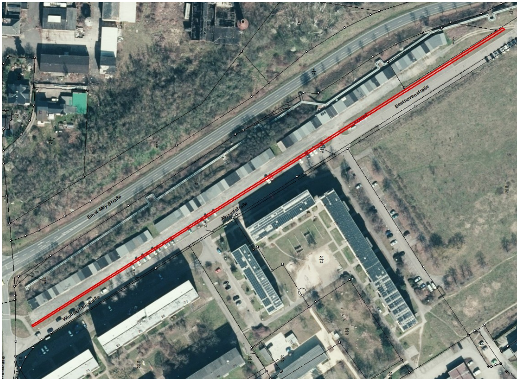
Flurstück 4/10 (Mozartstraße/Beethovenstraße)