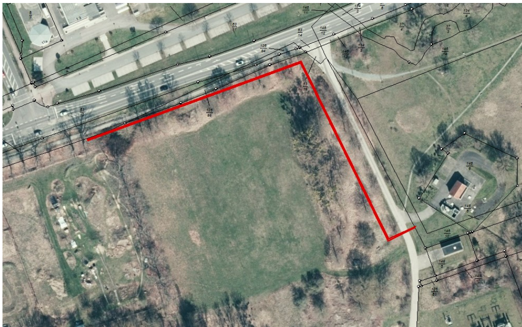
Flurstück 126/82 (Ziegelstraße/Dobritzmark)

Copyright- Stadtverwaltung Eilenburg - Staatsbetrieb Geobasisinformation und Vermessung Sachsen (GeoSN)