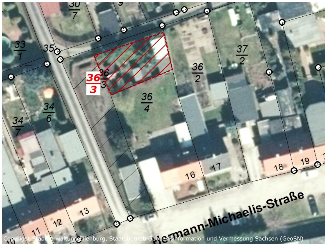
Flurstück 36/3 tlw., ca. 175 m 2 , Flur 44, Gemarkung Eilenburg (rot gekennzeichnet)

Mit Beschluss Nr. 13/2024 vom 27.05.2024 hat der Stadtausschuss dem Verkauf der Grundstücksteilfläche zu Hermann-Michaelis-Straße 16, Flurstück 36/3 tlw. (ca. 175 m 2 ) der Flur 44 in der Gemarkung Eilenburg zugestimmt.